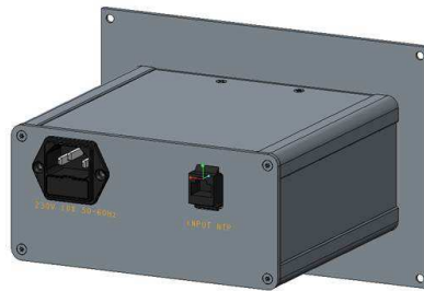
Face arrière pour version NTP/POE câble fourni: 3 m Ethernet CAT5E.