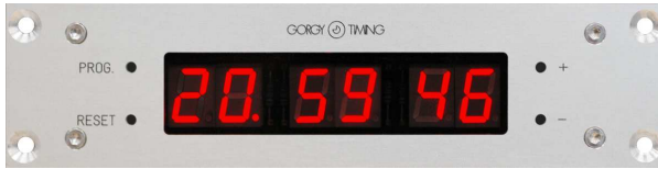
7 Segment LED Anzeige für Stunde Minute Sekunde