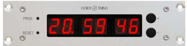
7 Segment LED Anzeige für Stunde Minute und Sekunde mit Programmier Tasten auf der Frontseite.